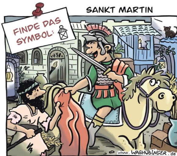
Lösung: Die Laterne ist rechts im Torbogen unter der Katze

Doch auch ihr könnt Menschen helfen, die in Not sind. Ihr könnt mit denen teilen, die weniger haben als ihr. Ihr könnt euer Schulbrot teilen mit dem, der seines vergessen hat. Ihr könnt euer Wissen teilen mit denen, die es schwerer in der Schule haben. Es gibt ganz viele Möglichkeiten, ein Martin zu sein.